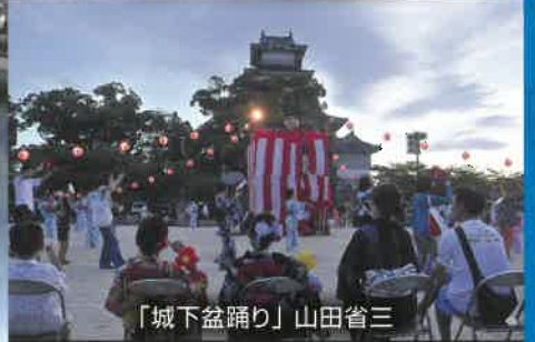
「城下盆踊り」山田省三