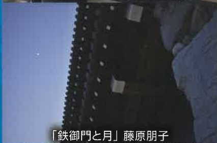
「鉄御門と月」藤原朋子