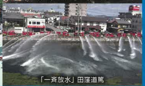
「一斉放水」田窪道篤

昨年度に開催した第2回今治城写真コンテストの入賞作品全20点を一堂に展示。今治城の素敵な、そしてユニークな一瞬を捉えた力作が揃いました。お気に入りの1枚を見つけてください。