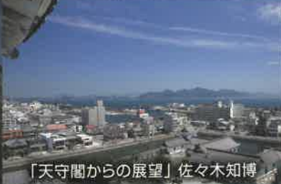
「天守閣からの展望」佐々木知博